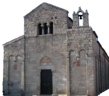
Parrocchia di San Simeone Olbia